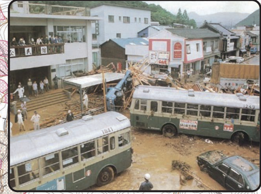
昭和57年7月23日長崎大水害の被災状況 現在の東公民館付近

最大規模の大雨(6時間総雨量597mm*)を想定した場合の浸水想定区域を表示しています。 *昭和57年長崎大水害では3日間で573mmを記録。