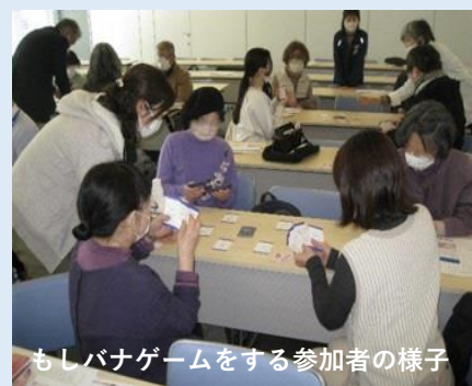
もしバナゲームをする参加者の様子

内容: 今回のまちななかサロンでは参加者全員が人生会議のきっかけ作りとなる『もしバナゲーム』を楽しみながら、もしもの時を語り合いました。「自身の想いを発見できた」「いろいろな考え方がありとても参考になった」という感想が聞かれました。