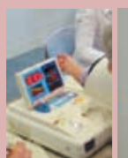
血圧・体脂肪測定