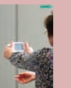
健康相談・お薬相談