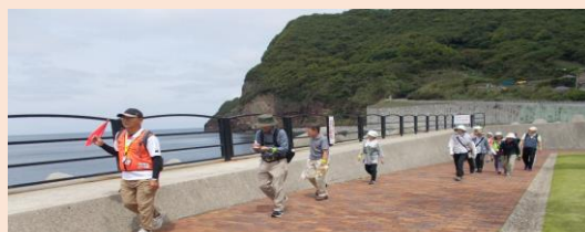
お手軽ウォーキング（福田サンセットコース）

「明日の健康づくりは今日の一步から」を目標に、市内のウォーキングコースを用いて定期的に「お手軽ウォーキング」を開催しています。