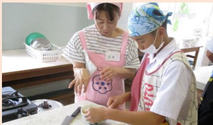
中学生を対象とした郷土料理教室

「私達の健康は私達の手で」をスローガンに料理講習会や健康教室を通して、自身の健康はもちろん家族やお隣さん、地域住民によりよい食生活を推進しています。