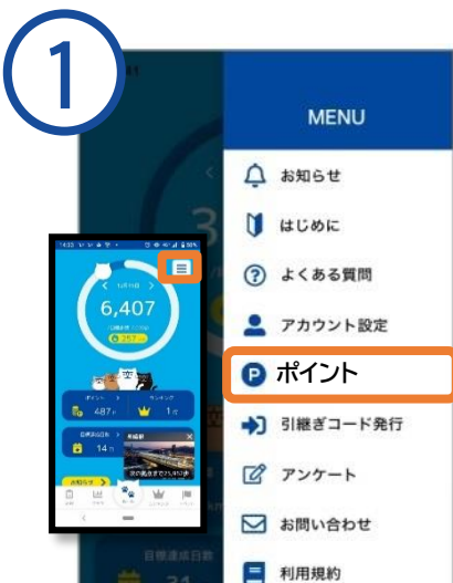
MENU画面から「ポイント」をタップ