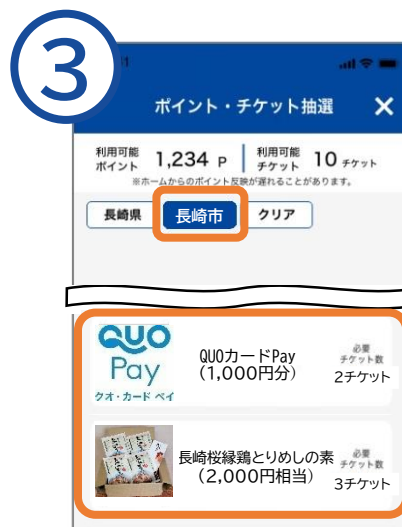
交換したチケット数に応じた賞品をタップ