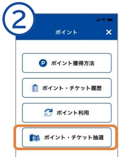
「ポイント・チケット抽選」をタップし、必要事項を入力