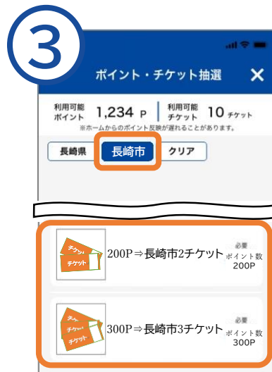
希望する抽選チケットをタップ