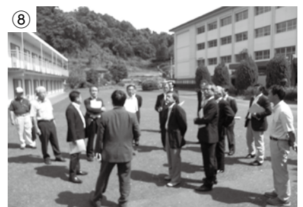
旧県立長崎南商業高校跡地を現地調査