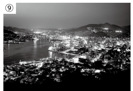
鍋冠山から見た長崎の夜景