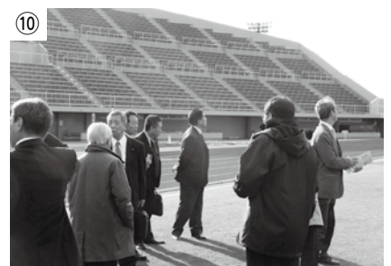
秋田市八橋陸上競技場を視察