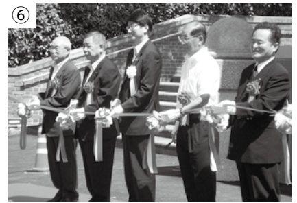
落成式のテープカット

12月14日 ○総額8億8,253万6千円の平成24年度長崎市一般会計補正予算（第5号）を可決 ○公の施設の指定管理者の指定についてを可決 （上長崎地区ふれあいセンター、琴海さざなみ会館など） ○長崎市暴力団排除条例を可決 ○地方独立行政法人長崎市立病院機構中期計画の変更の認可についてを可決 〔 市長提出議案41件について審議決定 〕