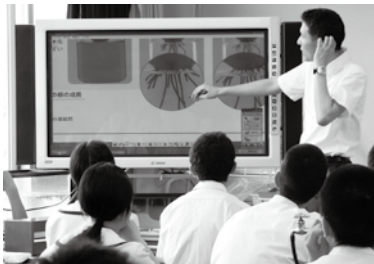
▲電子黒板での授業風景

ブレット型に切り替えるなど、ICT機器の整備と授業での活用を推進する予定である。