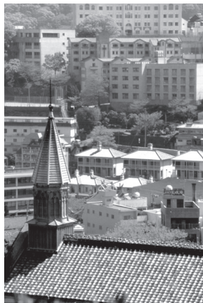
▲長崎独特のまちなみ

雨水渠損傷について、全ての原因や責任の所在が明らかになっていないことから、現段階で本議案についての議論はできないとの反対意見が出され、賛成なく否決すべきものと決定しました。