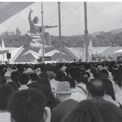
▲8月9日平和祈念式典の様子

今後とも、このような交流を通して、日米の相互理解を深め、来年予定されているサミットや2020年の東京オリンピックなどの機会をとらえて、実現に向けて取り組んでいきたい。