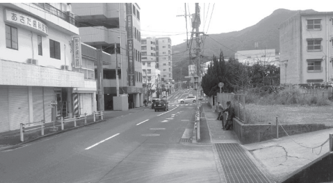
▲大神宮交差点(市道側)

そのため、市道においても、右折帯及びバスベイを整備することとしており、今年度に入