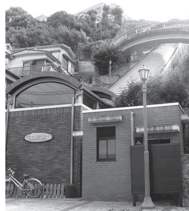
▲グラブスカイロード

問 市民や多くの観光客が利用している斜行エレベーターは、年間約1千万円の維持管理費がかかる。ゴンドラから見える壁に、企業等の広告を載せて収入を得るなどの考えはないか。