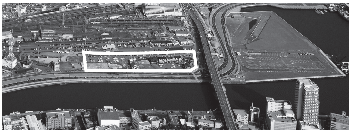
▲JR長崎駅西側の交流拠点施設用地

委員会では、小規模地権者が存在することを、平成26年度に交流拠点施設用地を購入する際に議会に説明しなかつた理由や、長崎駅周辺土地区画整理事業における仮換地指定の状況、交流拠点施設用地に新市庁舎を建設する可能性の有無についてなど、内容検討の結果、異議なく原案を可決しました。