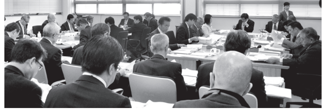
▲連合審査会の開催は、昭和49年以来、41年ぶり。(現地調査は除く。)