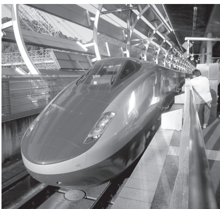
▲フリーゲージトレイン試験車両

委員会では、用地買収交渉の難航により不用額が発生しているため、関係部署との連携や、人員補強、専門職の配置を行い、用地交渉力を向上させることにより、事業年度内完成による不用額の圧縮に努めてほしい、道路計画や新幹線建設にあたっては、本市が原因で完成が遅れることがないよう、国、県や他の自治体、JR等と一体となつて十分な連携を図りながら進めてほしいなどの要望を付した賛成意見が出され、異議なく本決算を認定しました。