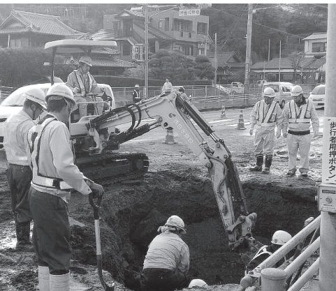
▲水道管復旧工事の様子

答 破損した管は、昭和40年代に布設しており、破損の原因は老朽化に伴う自然破損と考えている。また、耐用年数とされる布設後40年を経過した管は、昭和43年度から計画的に布設替えを行っているが、今回の事故や緊急点検結果などを踏まえ、優先順位の見直しを行うなど、再発防止に努めたい。