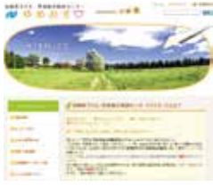
▲ゆめおすのホームページ 長崎県では、不登校、ひきこもり、ニート等、社会生活を円滑に営む上で様々な問題や悩みに対応するため、総合的に相談を受ける窓口として設置をしている。

また、市では、独自の子ども・若者支援地域協議会は設置していないが、庁内関係課の連携や情報共有化を図るとともに、長崎県子ども・若者総合相談センター「ゆめおす」とも連携して、就業や就学等の支援に努めたい。