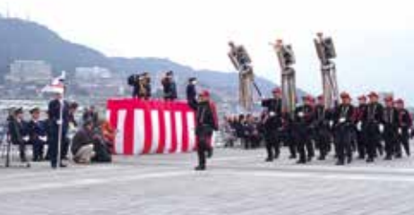
▲出初式パレードの様子

出初式のパレードや一斉放水の会場として利用する場合は、敷地の形状に応じた人の動きや会場のレイアウトなどを考慮する必要があることから、消防の方々と協議しながら、総合的な検討を行いたい。