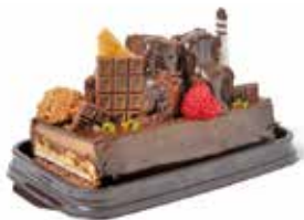
▲追憶[長崎市観光イメージアップお土産品開発コンテスト(2つの世界遺産部門)最優秀賞受賞商品]

また、旅行会社等への観光商品素材集の提供や、観光資源にちなんだ新たなお土産品開発コンテストの開催など、企業等との連携による商品開発や知名度アップに取り組んでいく。