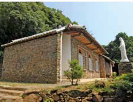
▲外海地区にある教会群の構成資産のひとつ「大野教会堂」

また、外海地区の宿泊施設整備については、遊休施設の活用も含め地元雇用を創出するような仕組みを検討したいと考えている。