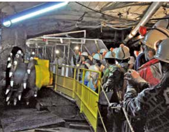
▲池島坑内体験の様子

池島の地域力向上は、長崎市の重点化方針に掲げており、住民の皆様と話をしながら、池島の強みを伸ばすという面と、暮らしやすさをつくるという面の、両面から取り組んでいきたい。