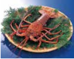
▲春が旬の長崎の海産物 (アラカブ・伊勢エビ)