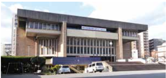
▲閉館した公会堂の場所に新市庁舎の建設を予定

なお、新たな文化施設の建設場所については、県庁舎跡地活用に係る県の検討状況を見極めながら、市としての判断を平成27年度内までに行いたい。