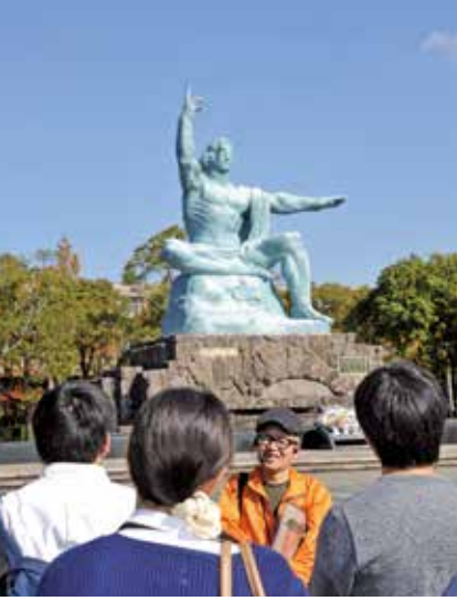
▲平和公園でのさるくの様子