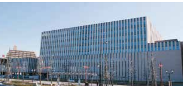
▲平成28年度中の全面開院を目指している。

また、ER型の救命救急センターの整備については、目標とした平成27年度までの整備はできなかったが、救急専門医の確保に向け全力で取り組み、早期に整備したい。