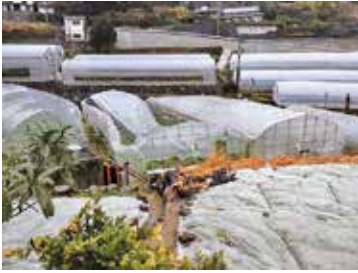
▲倒壊したビニールハウス

また、ハウス施設の被害対策については、早急な対応を検討している。災害を未然に防ぐ取り組みも重要であるため、本市の特性にあった支援策について前向きに検討したい。