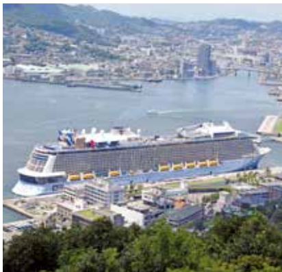
▲今年も多くのクルーズ船寄港が予想される松が枝国際観光船埠頭

都市基盤の整備に当たっては、県と連携を図り、国の地方創生の動きに迅速かつ的確に対応し、国の有利な財源等を積極的に活用しながら推進していく。