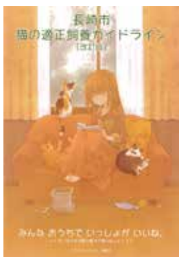
▲市のホームページで、猫の適正飼養ガイドラインがご覧になれます。

今後の課題としては、事業実施の条件である不妊化手術後の餌や糞尿等の管理が不十分である事例があるため、講習会実施の検討などを含め、なお一層の周知を図っていく必要がある。