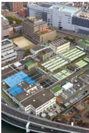
▲茂里町にある中部下水処理場

なお、建設要望地である茂里町の中部下水処理場跡地は市中心部にあり、まちづくりに重要な用地であるため、多方面から検討した上で活用策を見いだしたいと考えている。また、幸町工場跡地の活用についても、関係者による検討会の場において、将来のまちづくりに貢献する土地利用となるよう積極的に意見を述べていきたい。