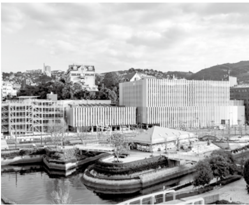
▲平成29年1月に全ての工事が終わり グランドオープン

また、小児・周産期医療については、新生児集中治療管理室を3床から6床に増床し、他の医療機関と連携することにより、ハイリスク出産や未熟児に対する医療を実施している。今後とも、リスクの高い32週未満の新生児の受け入れを進めることができるよう充実しに努めたい。