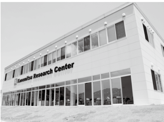
▲平成25年度に誘致した(株)カネミツ

答 製造業の誘致については、平成25年度に自動車関連部品の製造を行う株式会社カネミツを茂木地区に誘致するとともに、田中町の卸団地に隣接した用地について、企業立地用地として整備を進めている。今後も、既存の工業団地などを活用し、また、長崎市の産業や人材などの特性などを踏まえながら、引き続き積極的に取り組むたい。 若年者の人口流出については、新卒3年未満を主要な対象として対策を進めており、テレビ番組の放映や首都圏・福岡都市圏の大学などへの訪問による地元企業に関する情報提供、地元企業の県外での面談会参加の経費支援などに取り組んでいる。今後も、国や県の関係機関と連携した取り組みを進め、一人でも多くの若者が長崎で働くよう努めたい。