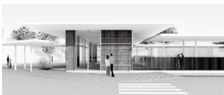
▲稲佐山中腹のスロープカー駅舎イメージ

その結果、稲佐山公園のスロープカー整備については、新たな夜景観光の資源として迅速に進めるとともに、市民や観光客のニーズにあったトイレや公園などの整備もあわせて進めてほしいなどの要望を付した賛成意見が出され、採決の結果、賛成多数で原案を可決しました。