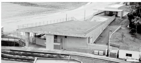
▲現在の指定管理期間は平成31年末まで

また、次期指定管理については、制度導入の効果や業務の範囲、選定方法などを検証し、経費の詳細な積算を行うとともに、関係部局と協議を重ねながら、運営のあり方を検討したい。