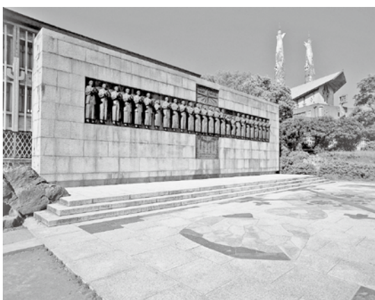
▲二十六聖人等身大のブロンズ像がはめ込まれた記念碑

また、枯松神社についても、まず、発掘調査の必要性などについて専門家などの意見を伺うなどし、潜伏キリシタン関連遺産の価値や魅力を語る上で密接な関連性があるこれらの遺産の価値の顕在化などに努めたい。