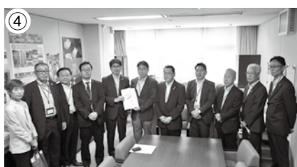
④ 九州新幹線西九州ルート沿線5市合同要望活動の様子