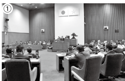
① 中距離核戦力(INF)全廃条約破棄に対する決議等を可決