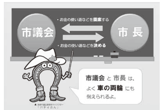
▲Vol.1 「市議会と市長はどんな関係?」の解説図