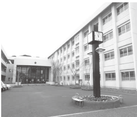
▲長崎商業高等学校

教育委員会としては、審議会からの意見を踏まえた学科改編を進めるとともに、市独自の人材確保の見通しが立った上で、新学科の設置を決定し、できるだけ早い段階での学科改編を目指したい。