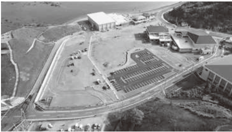
▲建設が進む恐竜パークの工事風景

南総合事務所が所管としてしっかりと取りまとめ、まずは指定管理者の選定を確実に進めたい。