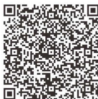
「特設ページ」 QRコード

今回、「決算審査の流れ」を説明しましたが、市議会のホームページでは、「教えて！バテイさん ～3分でわかる議会のしくみ～」の特設ページを開設し、「簡単で読みやすく、わかりやすい」をコンセプトに、議会についての「？」をバテイさんが解説していますので、そちらもご覧ください。