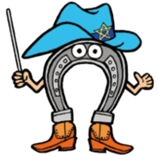
長崎市議会事務局キャラクター 「バテイさん」