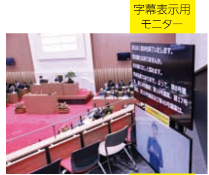
字幕表示用 モニター

さらに、会議の音声を鮮明に聴き取ることができるように 補聴援助機器 を貸し出していますので、利用を希望される場合は、傍聴の受付の際にお申し出ください。