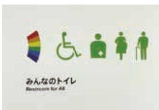
▲レインボーのピクトグラムの一例

答 レインボーのピクトグラム表示については、市庁舎の設計段階から市民団体等との意見交換やトイレメーカーなどが行ったアンケート調査結果をもとに検討を行ったが、表示の有無については様々な意見があったことから、最終的には表示に至っていない。しかしながら、性的少数者の心情を考慮するとともに、市内の施設においても、レインボーのピクトグラムを表示している事例があるため今後関係者の意見を聞きながら、みんなにやさしいトイレとなるよう検討を重ねていきたい。