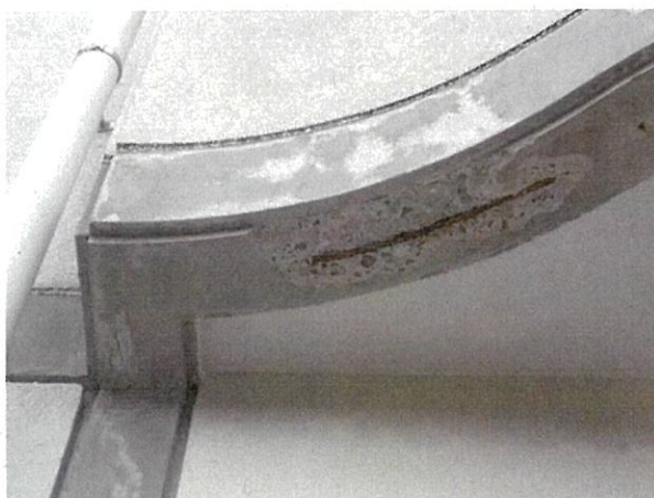
①バルコニー上裏部破損箇所