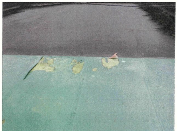
※屋上防水シート破損の様子