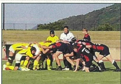
地元チームとの交流試合