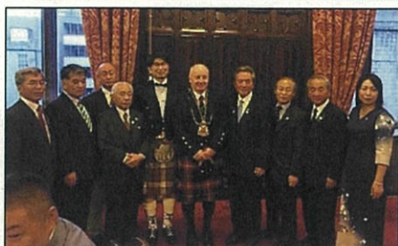
アバディーン市表敬訪問

平成 27 年 12 月、スコットランドラグビー協会から「長崎市で事前キャンプを実施する。」との連絡があり、平成 28 年 8 月 24 日にスコットランド代表チームの聖地であるマレーフィールドスタジアムで正式に事前キャンプの調印を締結しました。