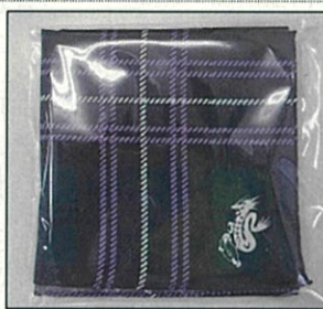
寄贈された長崎タータンを使用したハンカチ・ネクタイ