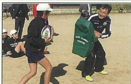
寄贈されたラグビーボール

平成 28 年 11 月 市へオリジナルタータン（長崎タータン）の寄贈 市内小中学校にラグビーボール 110 個の寄贈