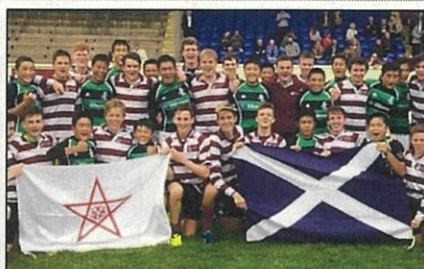
長崎県 U15 スコットランド遠征