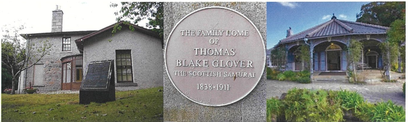
アバディーン市にあるグラバーハウス

グラバー氏が幼少期を過ごした、スコットランド北西部のアバディーン市と長崎市は、歴史的なつながりがあり、また、市民が主体となった交流が行われていることから、長崎市から市民友好都市の提案を行い、2010年に提携を行いました。