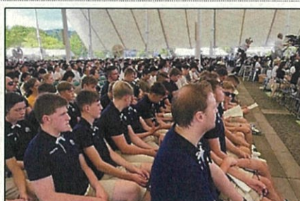
平和祈念式典への参列