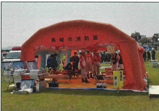
現場救護所の設置状況