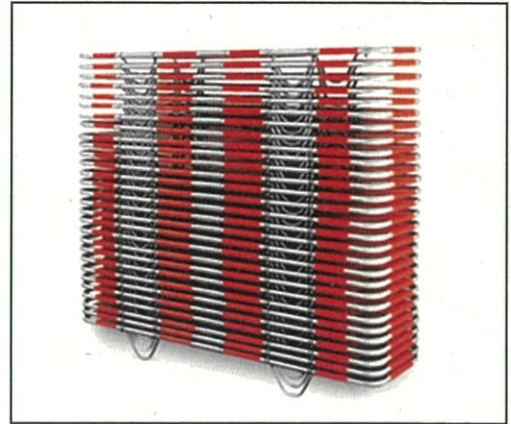
積み上げての保管状況

新型コロナウイルスクラスター発生等の災害時に担架として多数の傷病者を搬送し、現場救護所においては、そのままベッドとして活用できる、担架と簡易ベッドの機能を兼ね備えた資器材。