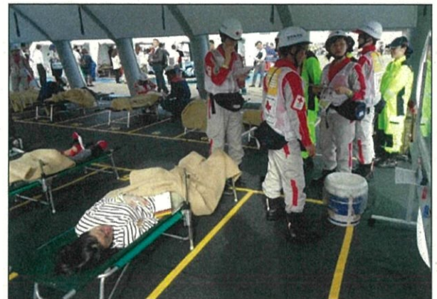
担架兼用簡易ベッドの配置状況