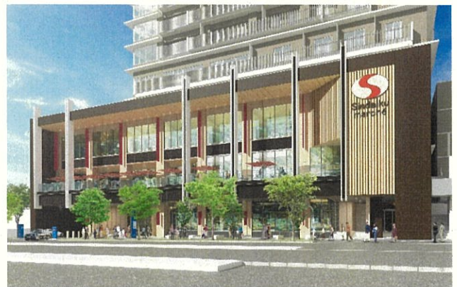
北街区（国道側より）