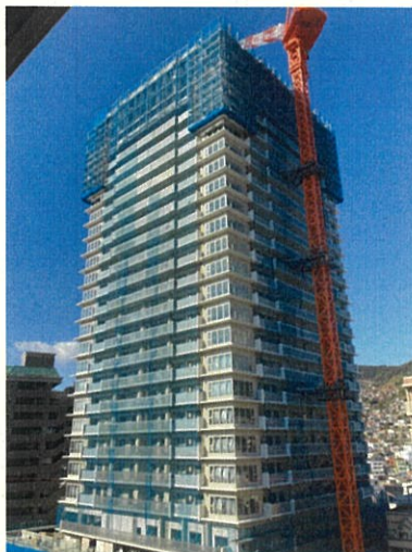
北街区（26階立上完了） 令和4年2月撮影