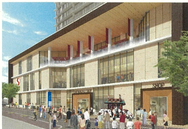
北街区(商店街西側より)