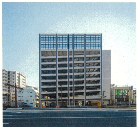
南街区（完成） 令和2年12月開業