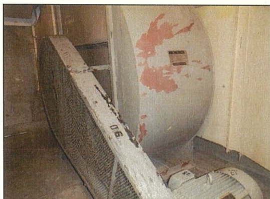
換気設備改修 (本体)