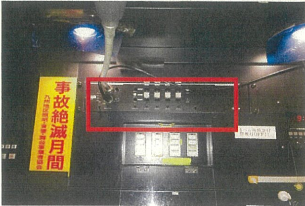
インカム設備メインステーション