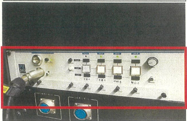
インカム設備サブステーション