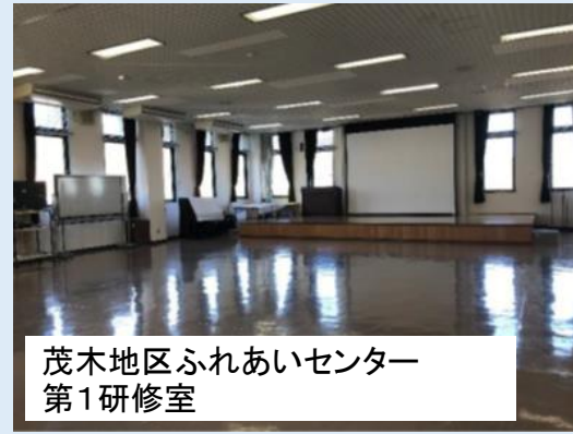
茂木地区ふれあいセンター 第1研修室