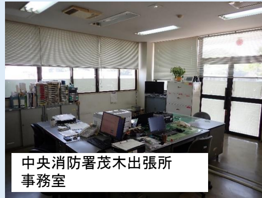
中央消防署茂木出張所 事務室