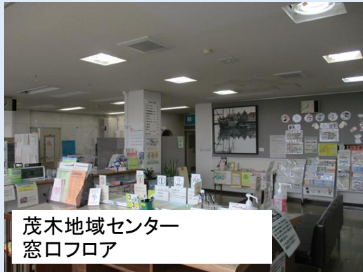
茂木地域センター 窓口フロア