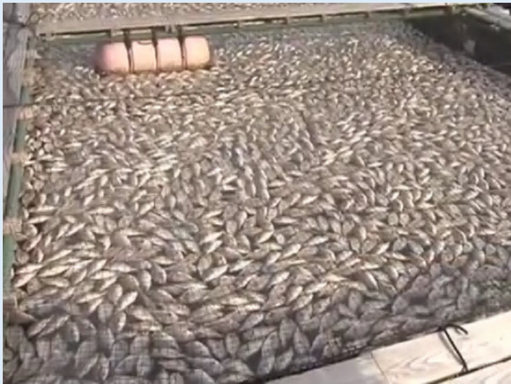
筏でへい死したマダイ