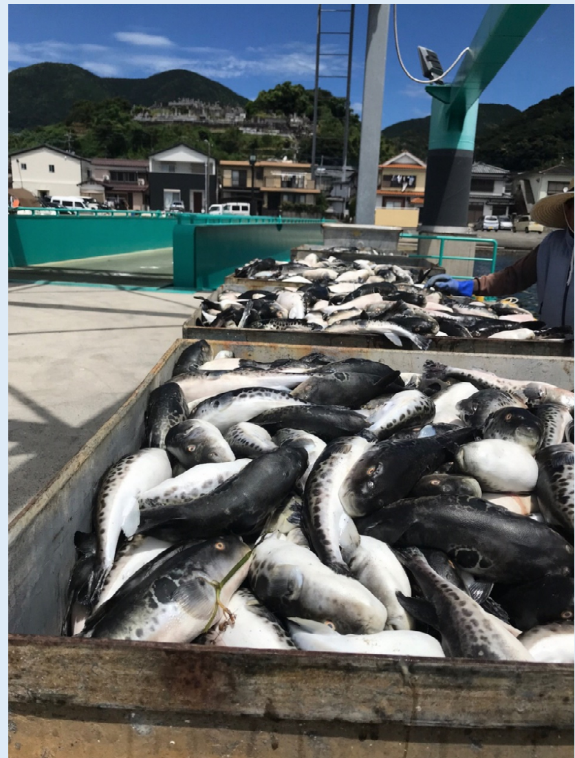
へい死により陸揚げされたトラフグ