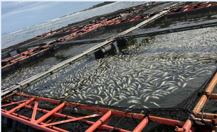
筏でへい死したトラフグ