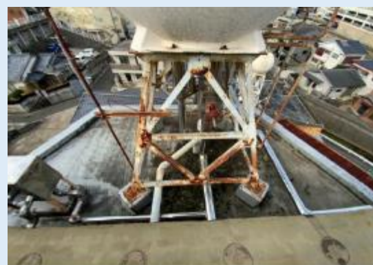
屋上水槽基礎(発錆)