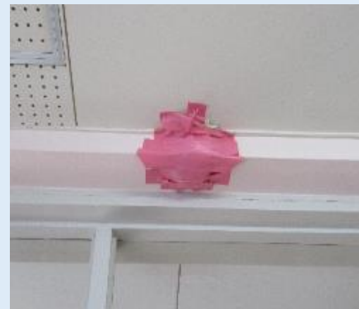
保育室の天井(雨漏り)