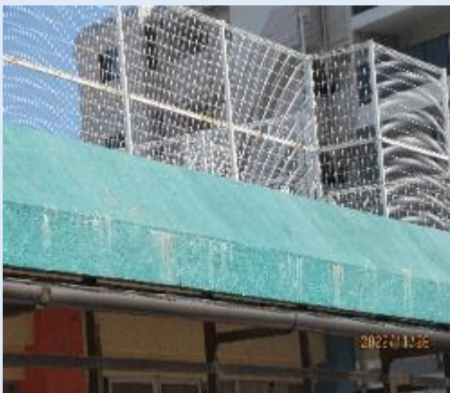
屋根部(剥離・劣化)