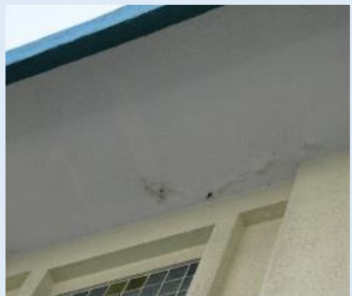
軒裏(亀裂・塗装剥離)