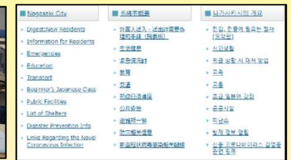
ホームページ 長崎市の概要