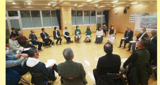
シンナガサキミーティング