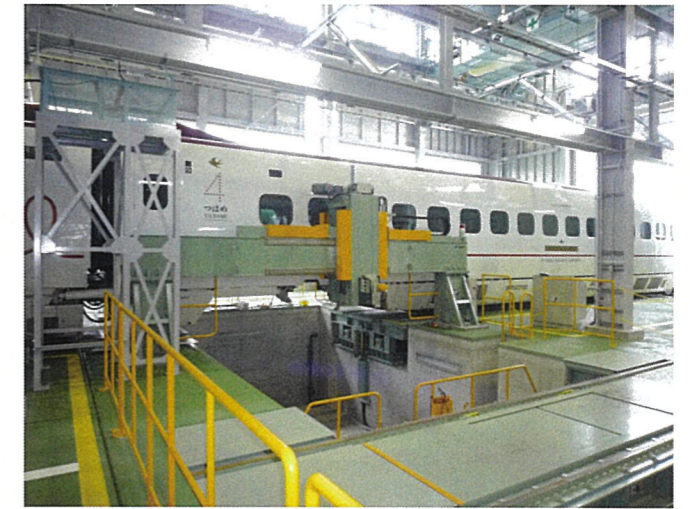
臨時修繕設備 (熊本総合車両所)