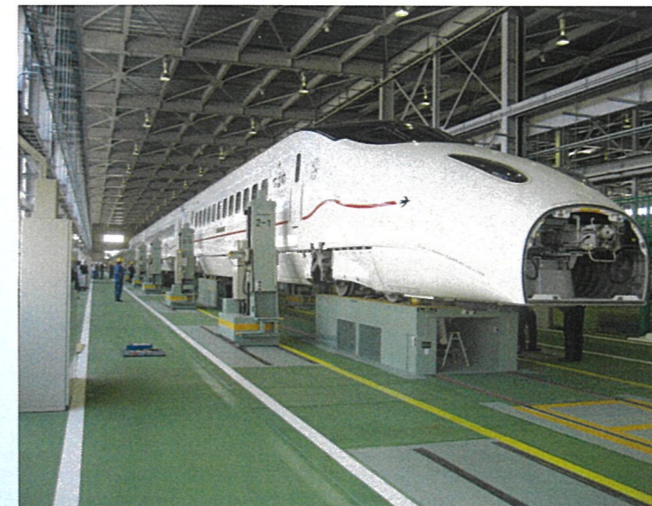
台車振替設備 (熊本総合車両所)