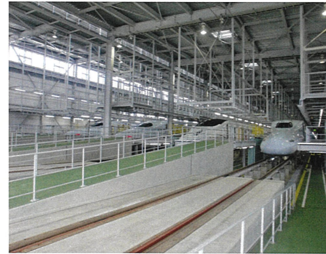
仕業・交番検査設備 (熊本総合車両所)

車両に不具合が生じたとき、必要に応じ行う検査・修繕です。主に臨修線・転削線で行います。