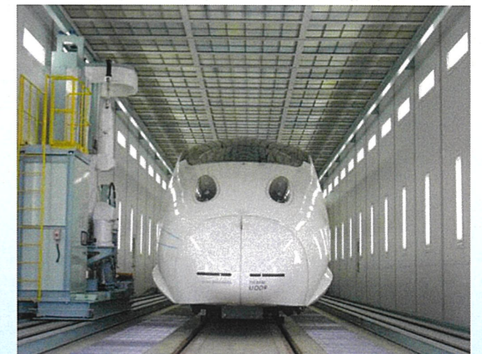
全般検査設備 (車体塗装) (熊本総合車両所)