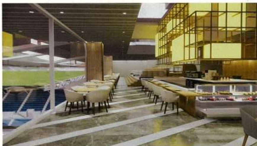
▲オールデイダイニング