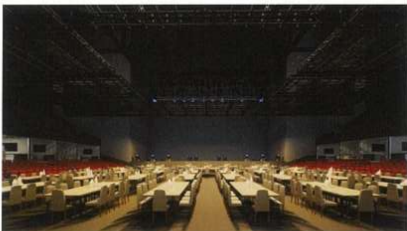
▲ 音楽+飲食イベント開催時