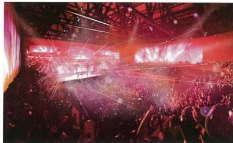
▲ 音楽イベント開催時