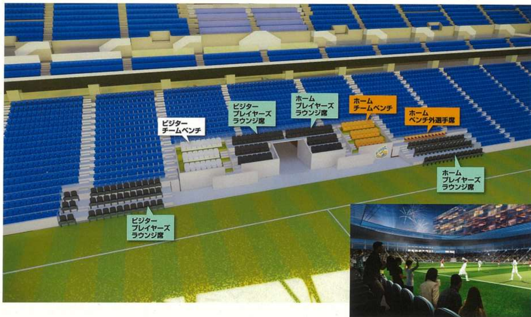
▲ プレイヤーズラウンジからの目線