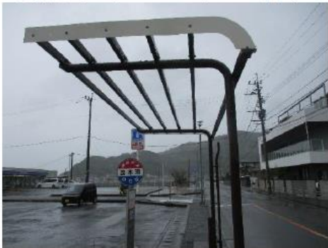
①茂木町75-8 (バス停屋根飛散)