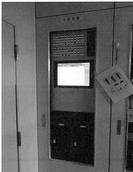
【中央監視盤等(全体)】