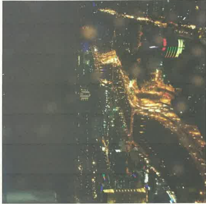
② ホーチミン市夜景