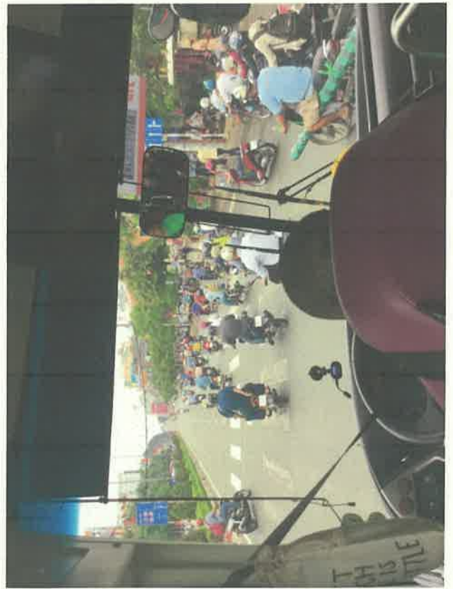
ホーチミン市の交通事情