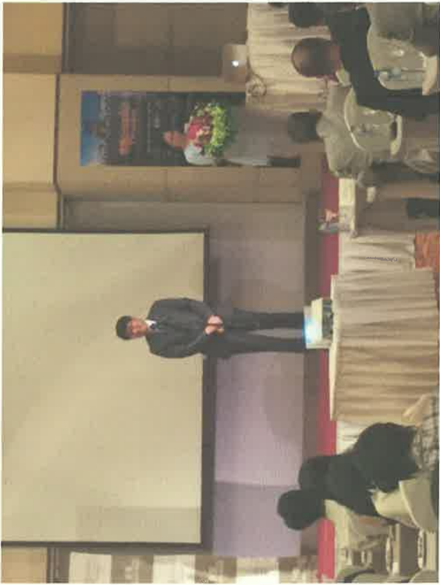
① 夜景サミットでの市長あいさつ