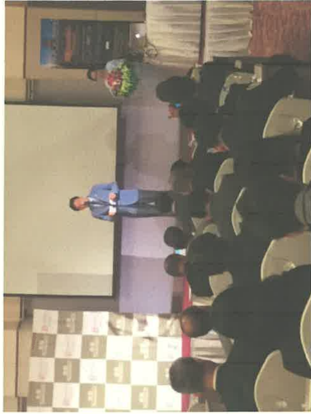
② ベトナム代表者あいさつ