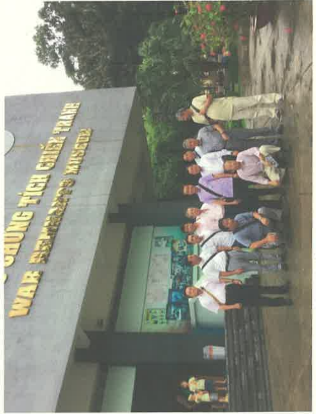
戦争証跡博物館で