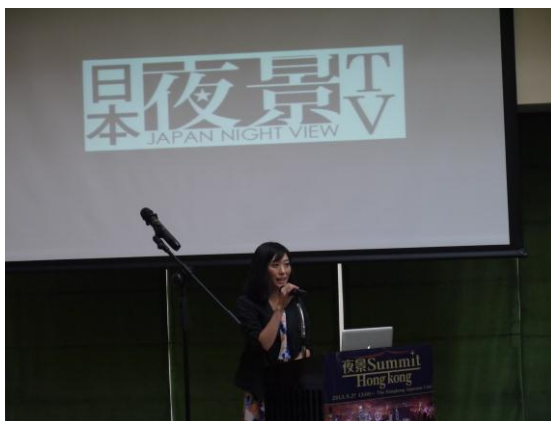
⑤ 日本夜景TVリリース発表