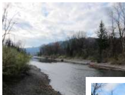
川の流れを緩やかに蛇行部分