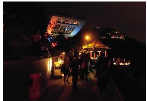
展望所がたくさん