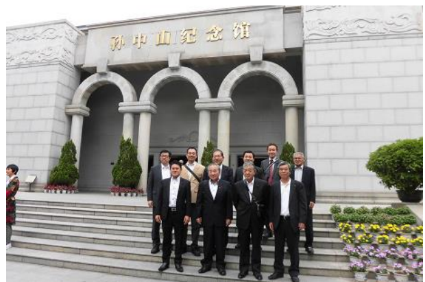
孫文故居記念館前で