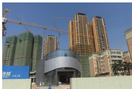
マンション建設状況（建設足場は竹）