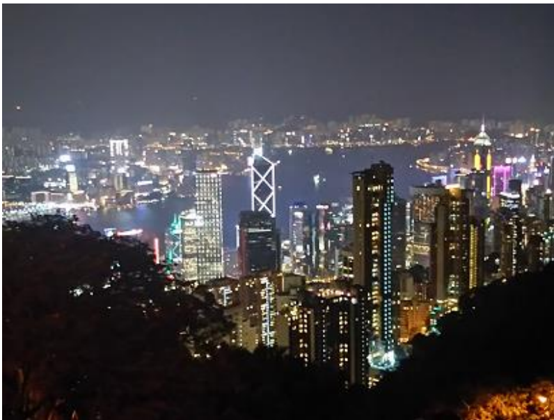
素晴らしい香港夜景

展望台はたくさんの人たちで溢れており観光客も国際色豊かでした。ベストポジションの場所へ案内された夜景は最高で、やはり香港夜景と思いました。しかし、時間の関係で残念ながら上の展望所などへも行き、違った方向の夜景も堪能してみたいと思いました。