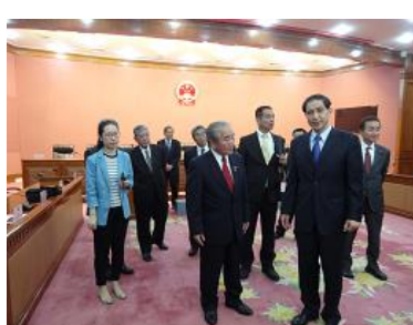
人民代表大会の議場視察