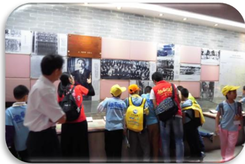
見学に来た子供たち