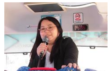
地元ガイドさんです