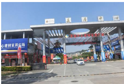
中山の街並み（区域には門が設置）