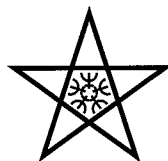
長崎市章 Emblem of Nagasaki City