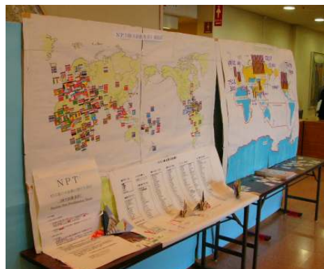
平和の輪をひろげる実行委員会 平和展