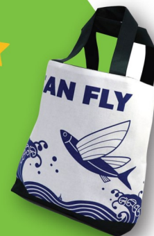
長崎お魚トートバック (清水の里) ¥3300