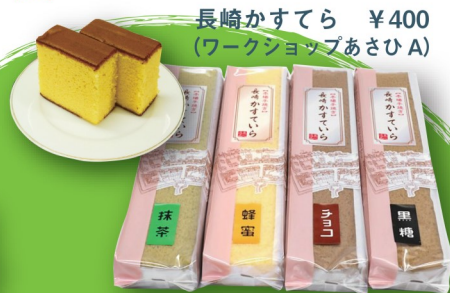
長崎かすてら ¥400 (ワークショップあさひ A)