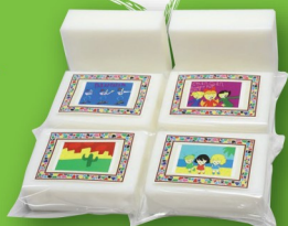
あおぞら石けん ¥170 (あおぞら)