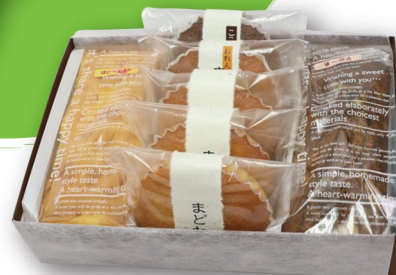
お菓子詰合わせ ¥2916 (さんらいず)