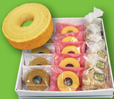
バームクーヘンセット ¥3300 (ながさきワークビレッジ)