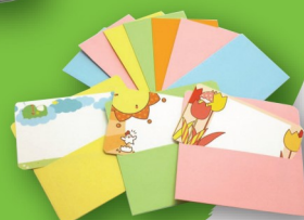
メッセージカード ¥600 (たまご)