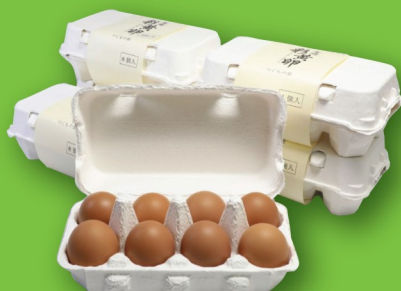
朝採れ玉子 ¥3000 (つくもの里)