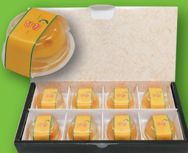
長崎びわゼリーセット ¥2700 (ワークステーションすばる)