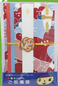
御祝儀袋 ¥300 (ながさきワークビレッジ)