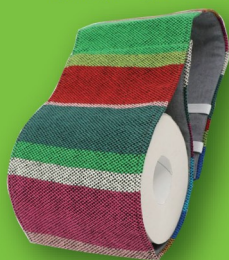
トイレトペーパー ホルダーカバー (さんらいず) ¥1100