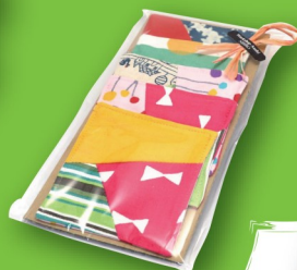
コースターセット ¥550 (ワークショップあさひ)