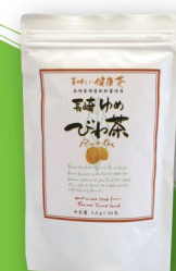
長崎ゆめびわ茶 ¥1080 (三和ゆめランド)