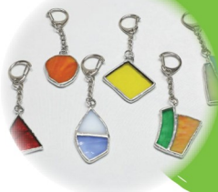
スタンドグラス キーホルダー (楽々工房) ¥550~