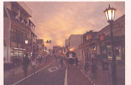
参考：千葉県成田市 （セットバック後に電線地中化、街路灯改修した事例）