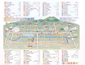
参考：茨城県つくば市北条商店街

商店街マップを作成し消費者へ配布するほか、来街者に分かりやすい場所に掲示し、より利便性と個店の魅力を高める。