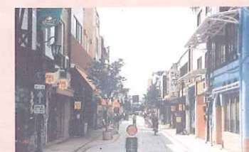
参考：広島県福山市（福山久松通商店街振興組合） 商店街等によるオープンモール整備計画が推進され、まちづくり協定・委員会の設置などが行われている。 （平成13年度「美しいまちなみ賞」受賞）