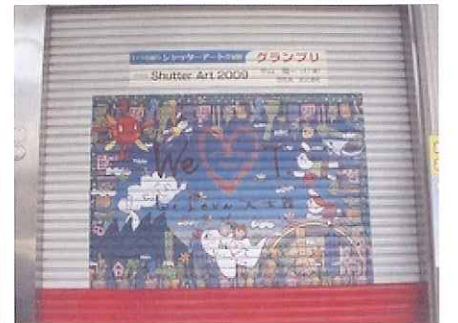
参考：鹿児島市天文館いづろ通り商店街 2009シャッターアートグランプリ受賞作

空き店舗のシャッターをアート化し、国際的な観光地であることをアピールする、また空き店舗での休憩所・案内所の設置などにより観光客の取込みを図る。