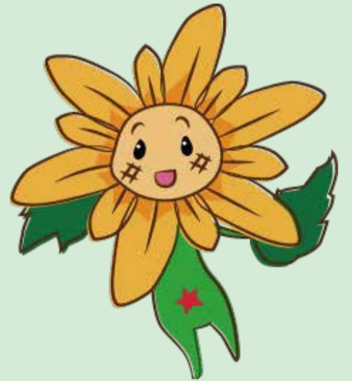
長崎市人権イメージキャラクター ヒマワリさん