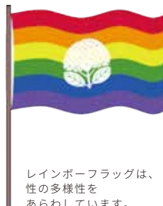
レインボーフラッグは、性の多様性をあらわしています。

その取組みの1つとして、性的少数者のカップルが、その関係性を市長に対して宣誓した事実を証明する長崎市パートナーシップ宣誓制度を令和元年9月から開始しました。