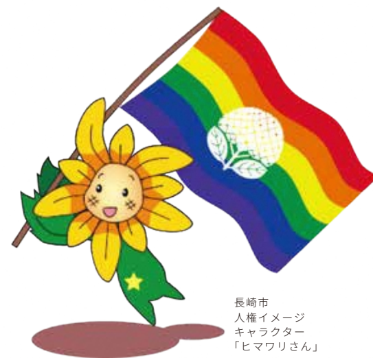
長崎市 人権イメージ キャラクター 「ヒマワリさん」