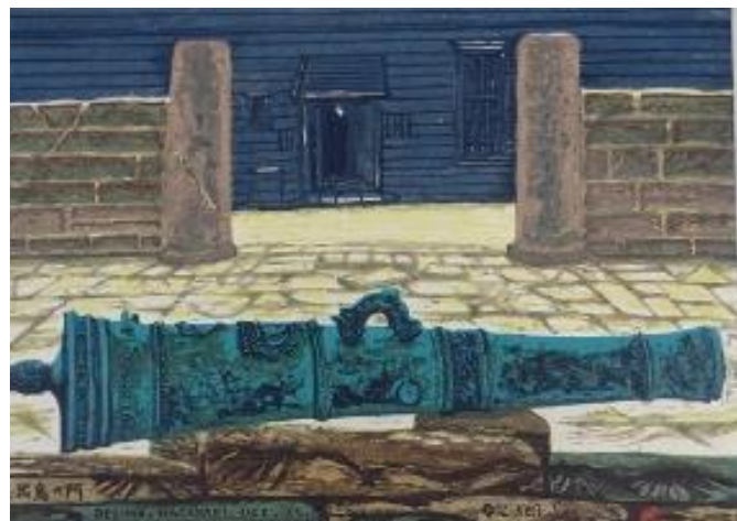
出島の門(田川 憲作) 昭和40(1965)年 白井和夫氏寄贈