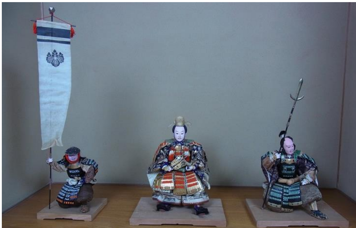
端午の節句人形(雑兵・豊臣秀吉・加藤清正)