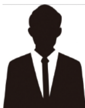
2級合格を目指す 30代男性

日本だけでなく、世界の様々な遺産を知ることができて、とても楽しかったです。月に一回の講座なので無理なく参加できました。欠席したときは、次の講座で前回の資料をもらえたので助かりました。