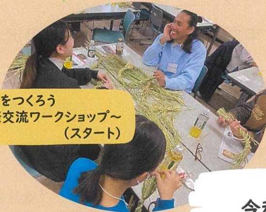
しめ縄をつくろう ～国際交流ワークショップ～ (スタート)