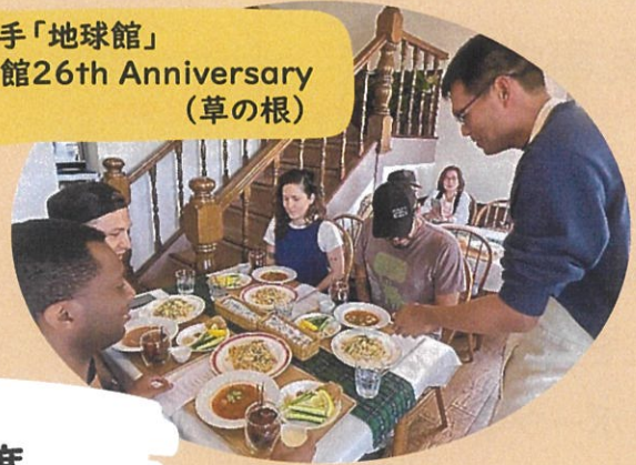
東山手「地球館」 開館26th Anniversary (草の根)