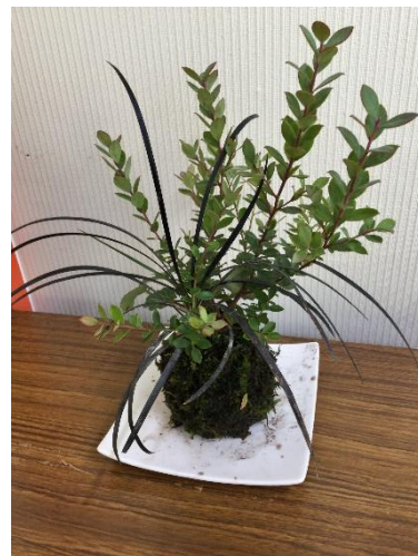
令和5年度秋の講座の作品 持ち帰ってからも長く楽しむことが できますよ！

期 日 令和6年6月18日（火） 時 間 10：00～12：00 場 所 長崎市東公民館 研修室4 （東部地区にここセンター2階） 対 象 成人 20名 講 師 松田 慎吾 先生 受講料 無料（ただし、材料費 1,500 円）