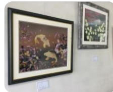
長崎ひがし写友会 (写真)