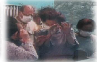
風速30mの暴風体験中