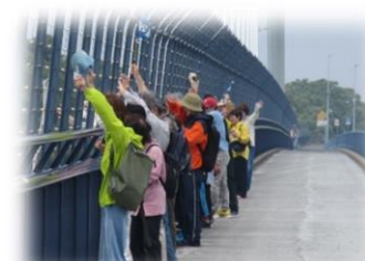
ふれあいウォーク「女神大橋からの眺望を楽しむ」 大迫力のクルーズ船