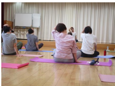
ルーシーダットン

「秋の講座」に多数の皆様から申込みいただき、ありがとうございました。9月から各講座が始まりました。まだまだ残暑厳しい時期ですが、各講座が、体を動かし、頭をつかい、共に学び合う機会となることを願っています。