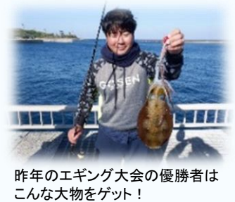
昨年のエギング大会の優勝者はこんな大物をゲット!