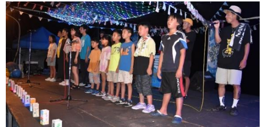
高島の子どもたちは、自分たちで手作りした「平和のキャンドル」をステージにならべて歌いました。

「RAINBOW MUSIC」のステージには高島の子どもたちも共演して、美しい歌声を会場いっぱいに響かせました。