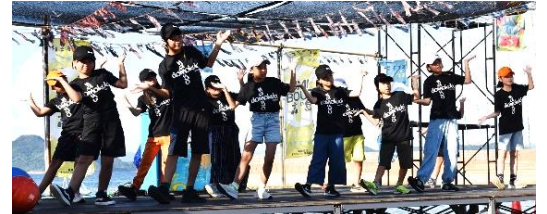
土井首地区コミュニティ協議会の「土井首HIPHOPダンススクール」の皆さんも素晴らしいパフォーマンスを披露

8月26日（土）、高島海水浴場で高島地区まちづくり推進協議会主催による「タカシマタカラジマ ～音光祭2023～」が開催されました。