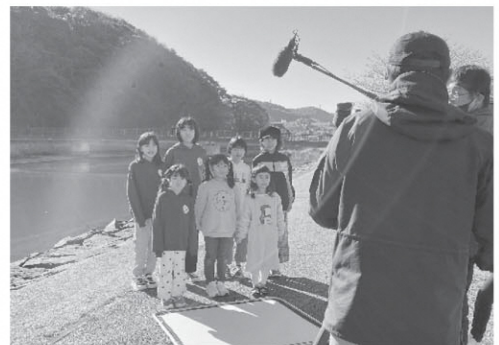
CM撮影の様子