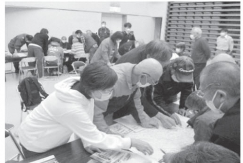
防災マップ作り体験の様子

近年、異常気象の影響等により、大雨、大型台風、巨大地震等の自然災害が頻発しており、災害に対する備えや知識、発生した時の対応力を高めようと開催されました。集いでは、防災講話の後防災マップ作り体験、救急搬送や消火訓練等の防災実習が行われ、参加者の皆さんは災害時に備え熱心に取り組んでいました。